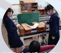
実験によるデータ収集