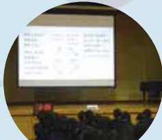
探究の基礎を学ぶ