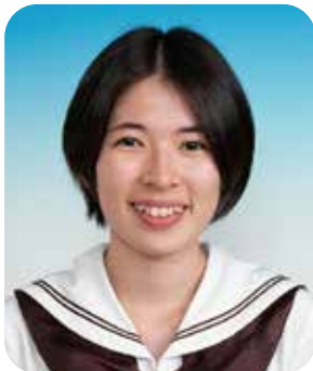
令和6年度 嚶鳴校友会会長