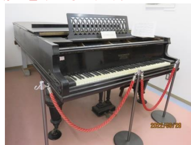
会館入り口に置かれているシートマイヤーのピアノ