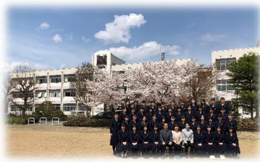
～おまけ～ (桜の前で集合写真) 西高の桜も満開です！ 来年の春には、3年次生に「サクサク」ように願っています！